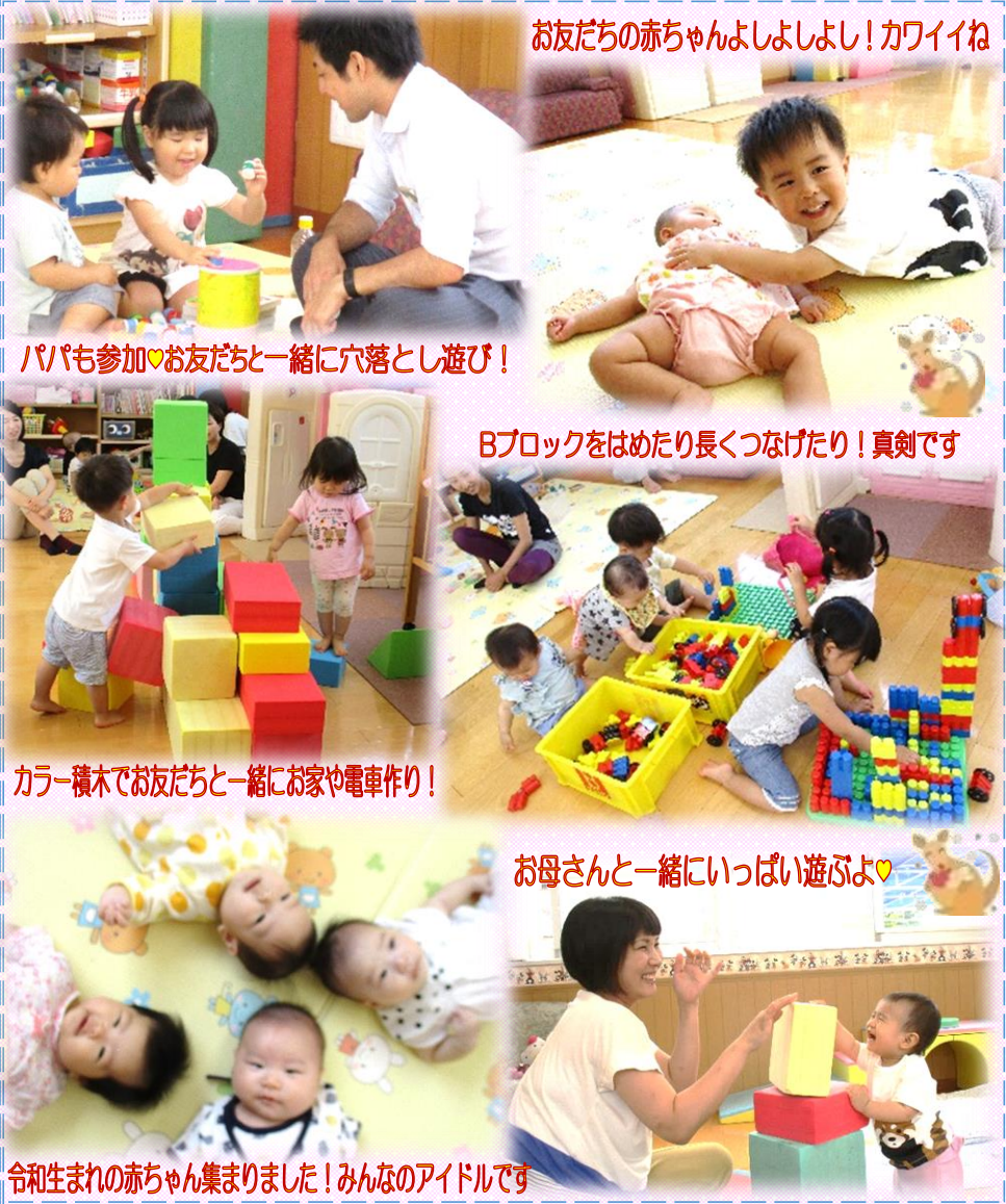
お友だちの赤ちゃんよしよし! カワイイね