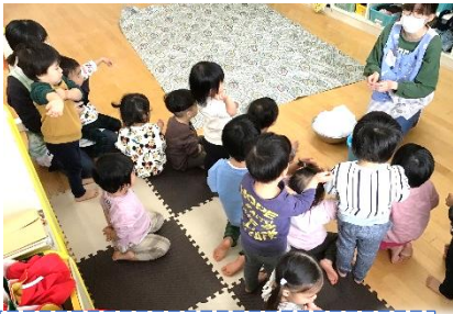
腕まくりをして準備万端!