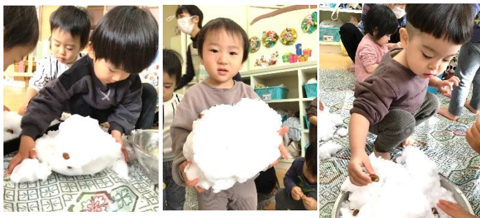
雪の塊に埋まるどんぐりを探して「どこかな〜?」と探したり、自分でも埋めてみたり…

今日は室内で触る程度でしたが、年明けに雪遊びセットが揃ったら今度は園庭などで思い切り雪遊びを楽しみたいと思います。ご用意よろしくお願ひいたします。