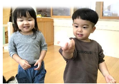
持ってみて「冷たいね〜」