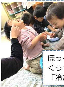
ほっぺにくっついて「冷たい!!」